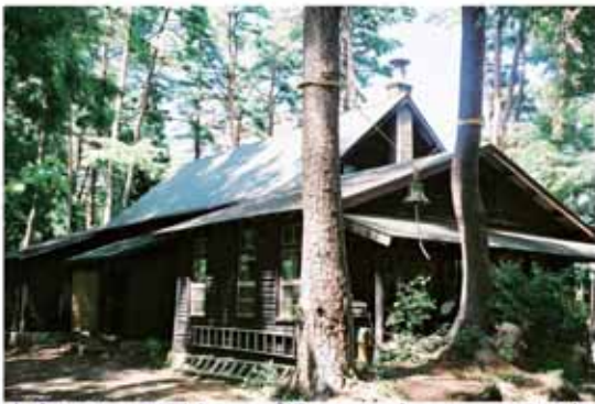
東京YWCA野尻キャンプ場 メインホール 1932年

東京YWCAは、1931年、長野県野尻湖畔で教育キャンプを開始し、翌1932年には野尻湖畔の半島「琵琶が崎」をキャンプ場とし、80年にわたり教育キャンプを行ってきました。キャンプ場に残る1932年当時の建物は、ヴォーリズ的设计、あるいはヴォーリズの影響を受けたものとして伝えられており、そこで過ごした青少年たちは、楽しかったキャンプ体験と共に合理的でありながら優しさに満ちた建物から深い懐かしさを与えられています。野尻キャンプ場80周年を節目に、今後の教育キャンプ、そしてキャンプ場の在り方を展望するために、改めてヴォーリズ思想と実践に学ぶことを目的にプログラムを開催します。